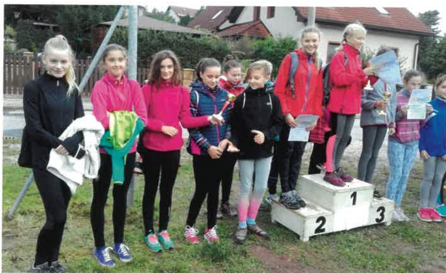
ZŠ Sobotka – přespolní běh (kategorie mladších dívek)