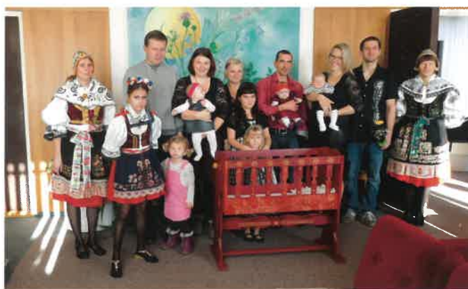
Vítání občáňků – foto: H. Žaloudková