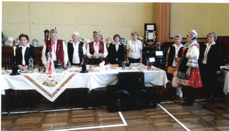
Vlastenecko dobročinná obec baráčníků pro Sobotku a okolí – Výroční volební zasedání