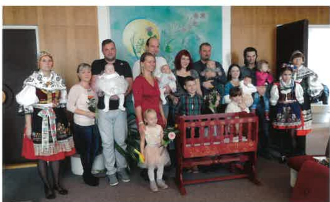
Vítání občáňků