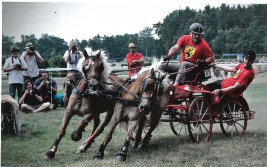
Jezdecký klub Sobotka