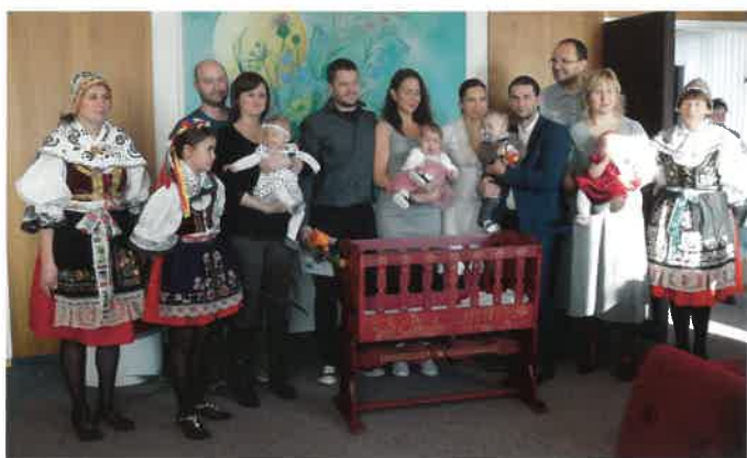
Vítání občáňků