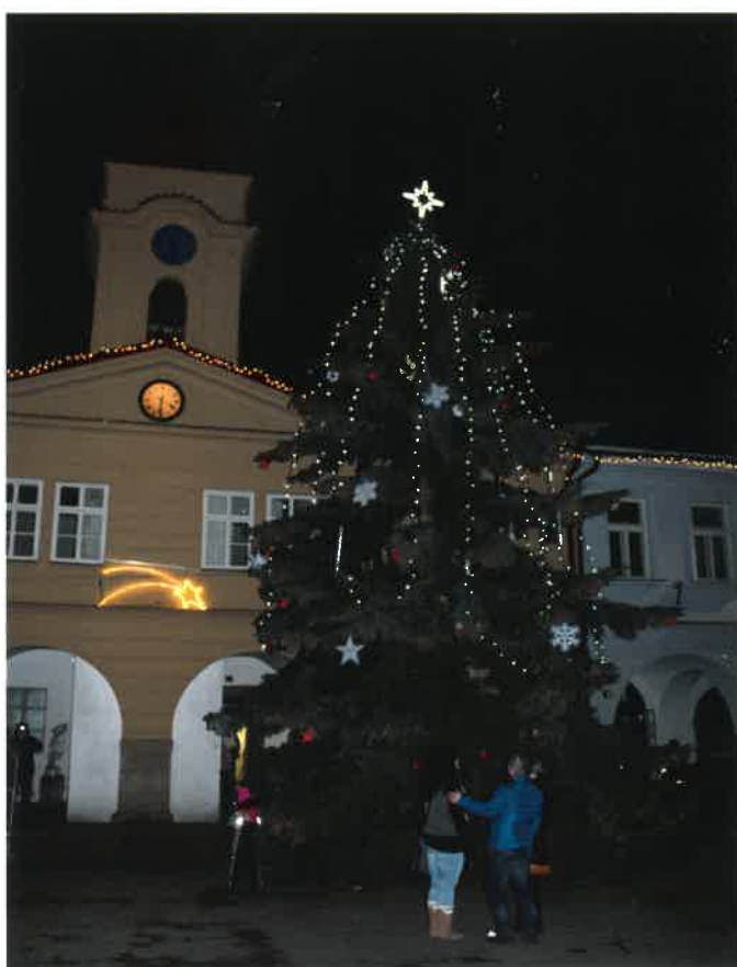
Rozsvícení vánočního stromu v Sobotce