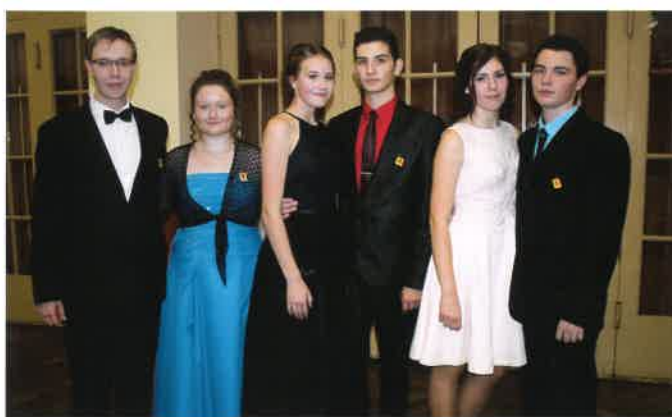
Taneční kurz 2017 – prodloužená.