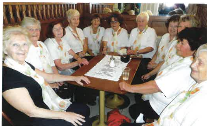
Sobotké sokolky v cukrárně „Stáza“ v Sobotce